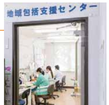
鶴間地域包括支援センター (サンホーム鶴間内) 担当地区: 鶴間・西鶴間

「この地域にサンホーム鶴間があって本当によかった」と一人でも多くの方々から思っていただけのように、「明るく・楽しく・元気よく」をモットーに職員一同頑張っ