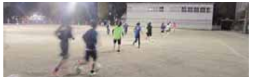
25分間ドリブル走。ラスト5分スピードアップ！ 苦しいときこそ頑張れ！！

サッカーの技術だけではなく、礼儀やマナーが身に付くこと。学校生活や進路のこと等を親身に相談に乗ってもらえること。苦楽を共にした素晴らしい仲間に出会えたこと。入団して良かったことを挙げるとキリがありませんが、メリハリをつけて、物事に向き合う集中力を培うことが出来ました。