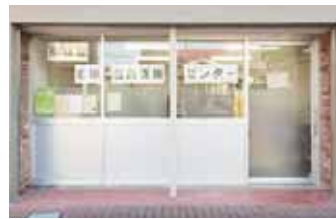
南林間地域包括支援センター (南林間駅西口から徒歩2分) 担当地区: 南林間・林間