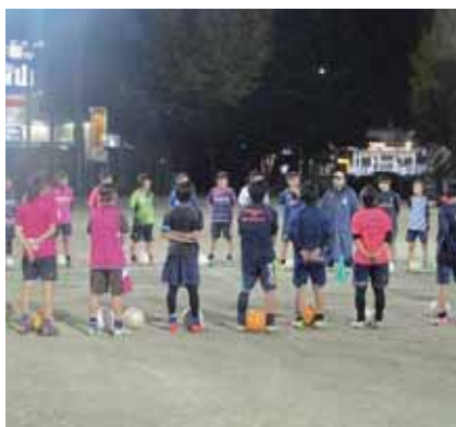
練習開始前のミーティング。監督を中心に集まります。