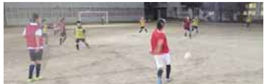
フォーメーション練習。 オフェンスとディフェンスに分かれて連携の確認。