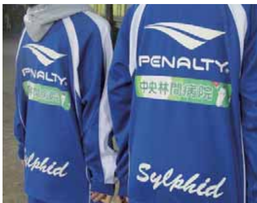
子どもたちが着用するジャージにたくみんを発見!