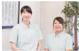
特別養護老人ホームの相談員。 この笑顔と明るさで元気をお裾分けしてくれます!