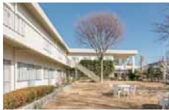
広い園庭。 春には大きな桜の木がとても綺麗です。